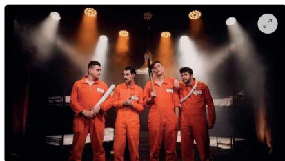
Le spectacle « 8 m 2 » se joue depuis février 2022 au cabaret Le Pâtis, rue d'Éclithal au Mans.

Le théâtre mançais s'apprête à faire escale en Provence. La pièce « 8 m 2 », née au Mans durant le confinement de novembre 2020 et créée au cabaret Le Pâtis à partir de février 2022, se délocalise jusqu'au Festival off d'Avignon , où elle sera jouée du 7 au 28 juillet 2023. L'occasion pour les Vauclusiens (mais pas que) de découvrir cette comédie déjantée. Imaginez quatre hommes que tout oppose, ni innocents ni coupables, contraints de cohabiter dans une cellule de prison collective, veillés par l'œil d'un géolier mordu d'accordéon.